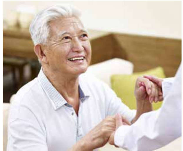
長照機構法人化，讓長者受到更完善的照護。

民眾參觀住宿式長照機構時，可以多觀察入住長輩的眼神、表情、人際互動與整體照顧情況，從