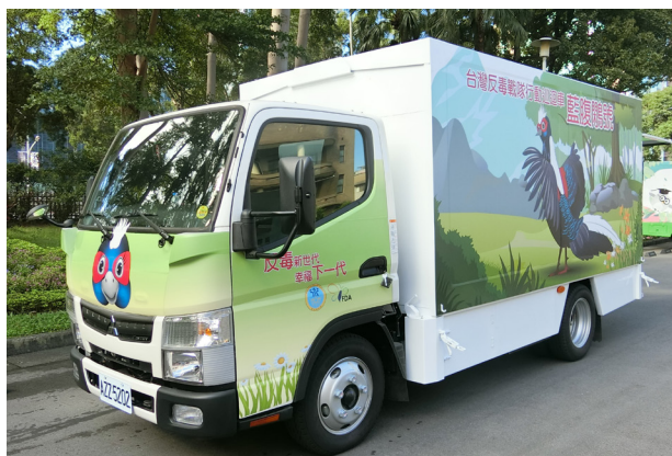
藍腹鵝號外觀亮眼，常吸引民眾目光。

「藥物濫用者常菸不離手，菸、酒、毒等成癮物質常合併使用，所以藍腹鵝號在臺南，也結合