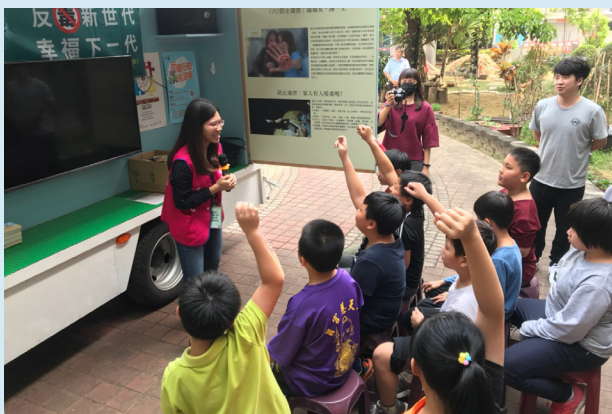
許多學生透過藍腹鵬號巡迴宣導活動，獲得許多反毒實用資訊。