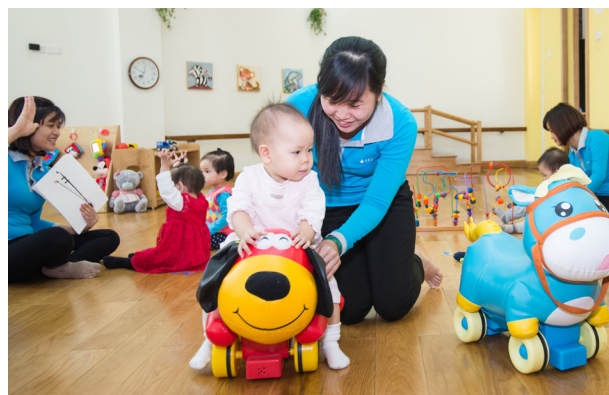
衛生福利部延長托育費用補助至未滿3歲的幼兒，以無縫銜接2-3歲幼兒家長們的托育需求。

選擇符合一定資格條件與地方政府簽約的居家保母及私立托嬰中心之托育家庭，也可依家庭經濟條件，向政府申請每月6,000元至1萬元不等的托育費用補助。如此一來，既能實質減輕家長托育負擔，讓托育支出控制在家庭可支配所得的10%-15% (約8,000元至12,000元)，也可尊重家長們的選擇權，為不同照顧需求的家長提供更多